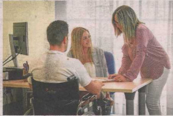
►► Atención en el Centro de Apoyo Social de Fundación DFA.

Desde el pasado lunes 11 de mayo, con el proceso de desescalada del confinamiento sanitario, ha comenzado la reapertura de algunos servicios de Fundación DFA. Los Centros de Apoyo Social han comenzado a ofrecer atención presencial, siempre con las medidas de protección necesarias, aunque también continúa ofreciéndose atención vía telefónica para aquellas personas que no quieran o no pue-