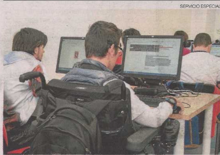
►► Alumnos de PCI en un aula de Fundación DFA.

Los y las jóvenes de los PCI acuden de manera habitual a sus aulas, situadas en el edificio Josemi Monserrate de DFA. Ahora, han tenido que cambiar este espacio por una formación 'a distancia'.